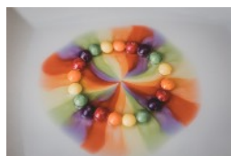
GRUPPEN FÜR KINDER UND JUGENDLICHE