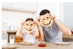
ONLINE-SEMINARE FÜR FAMILIEN ZU ERZIEHUNGS- UND FAMILIENTHEMEN