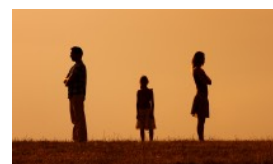
ANGEBOTE FÜR FAMILIEN IN TRENNUNG